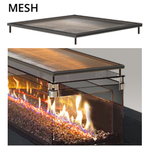
Gas-Einbaubox Domino mit Doppelverglasung und Mesh