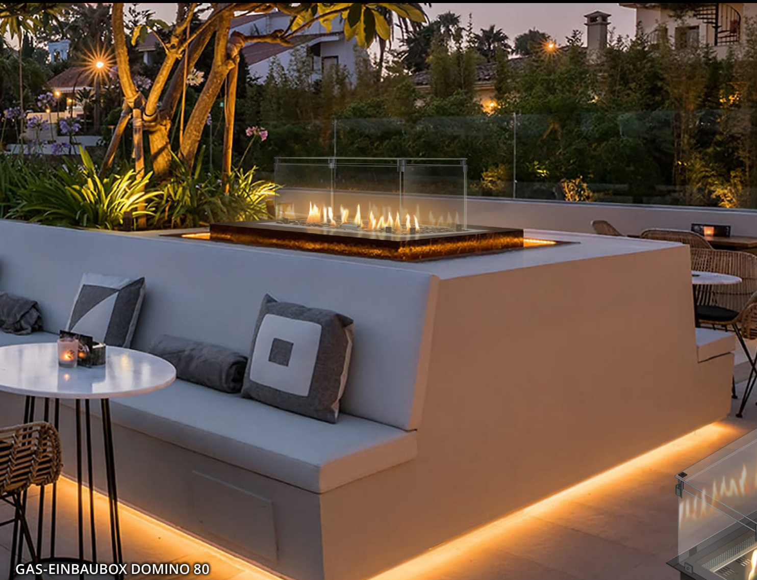
GAS-EINBAUBOX DOMINO 80