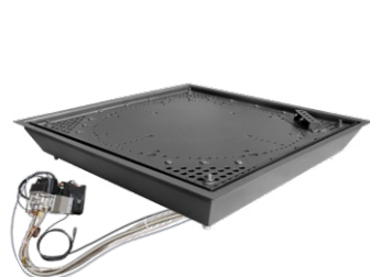
GASBRENNER SQUARE 40