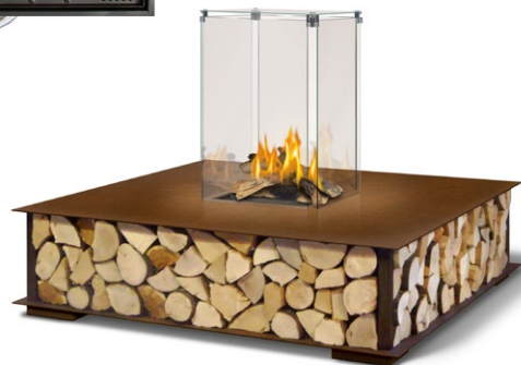
BENCH MIT GASBOX SQUARE 40