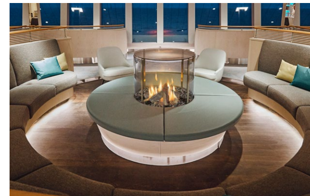
SONDERMODELL MIT GASBOX SQUARE 40