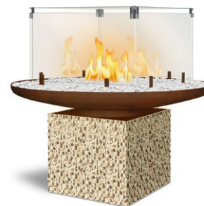
LODGE MIT SOCKEL MIT GASBOX SQUARE 40